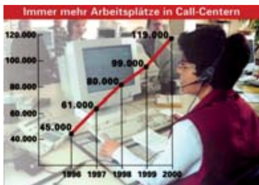
Alemania registra un aumento del número de puestos de trabajo en centros de llamadas

En el estudio, los expertos hicieron especial hincapié en los riesgos multifactoriales. La bibliografía se centra en los centros de llamadas que últimamente se han multiplicado y que ofrecen nuevos tipos de trabajo con exposición múltiple: mucho tiempo sentado, ruido de fondo, auriculares inadecuados, mal diseño ergonómico, bajo control de las tareas, presión debida a los plazos, alta exigencia mental y emocional. Las personas que trabajan en los centros de llamadas presentan trastornos musculoesqueléticos, venas varicosas, enfermedades de la nariz y la garganta, trastornos de la voz, estrés y síndrome de estar quemado.